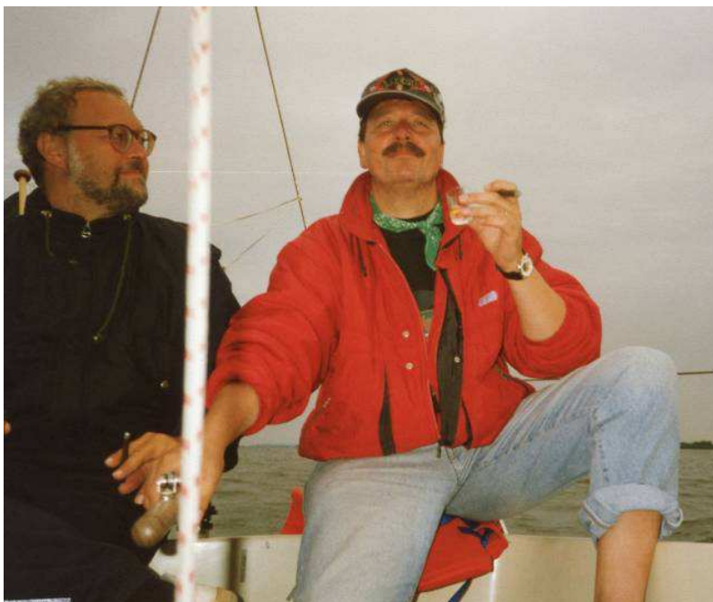
Oben: Seekrank in Stavoren